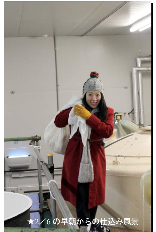
★2/6の早朝からの仕込み風景